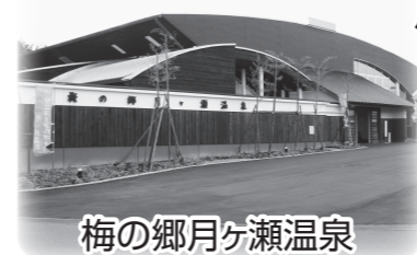
梅の郷月ヶ瀬温泉