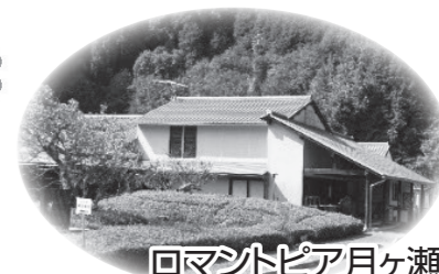
ロマンチックピア月ヶ瀬