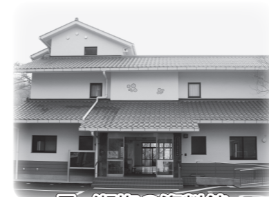
月ヶ瀬梅の資料館

主催者は、個人情報の重要性を認識し、個人情報の保護に関する法律及び関連法律等を遵守し、主催者の個人情報保護方針に基づき、個人情報を取り扱います。大会参加者へのサービス向上を目的とし、参加案内、記録通知、関連情報の通知、次回大会の案内、大会協賛・協力・関係者団体からのサービスの提供、記録発表(ランキング等)に利用いたします。