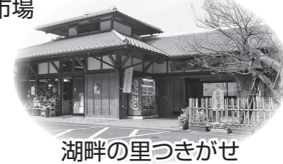
湖畔の里つきがせ