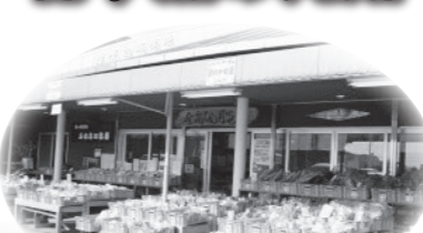
月ヶ瀬温泉ふれあい市場